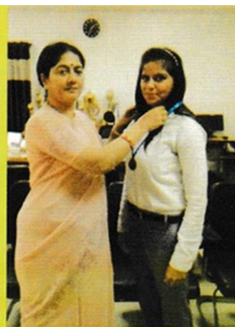
GOLD MEDALIST IN HALF MARATHON