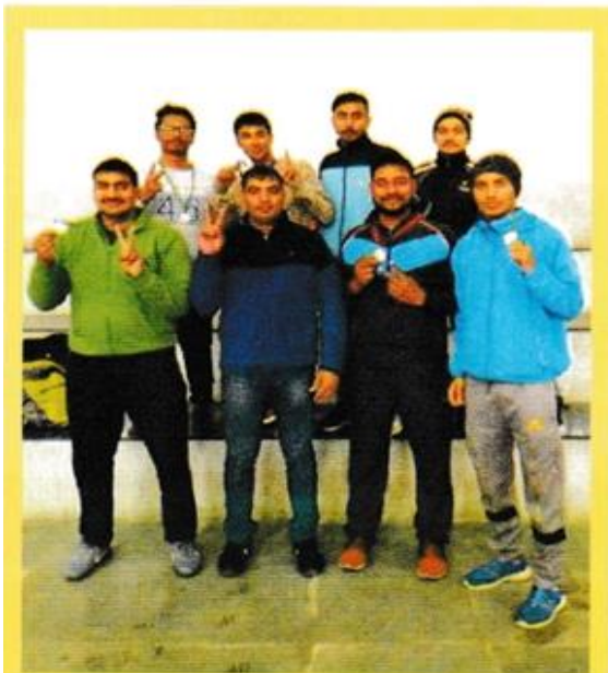
Inter college Wushu championship (1 Gold, 3 Silver, 1 Bronze)