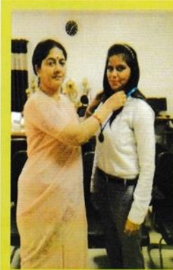
GOLD MEDALIST IN HALF MARATHON