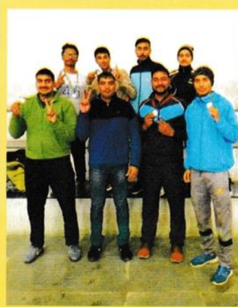
Inter college Wushu championship (1 Gold, 3 Silver, 1 Bronze)