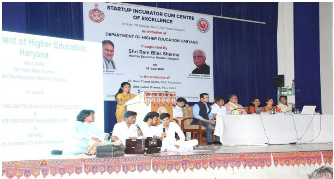
Inauguration by Hon'ble Education Minister, Haryana